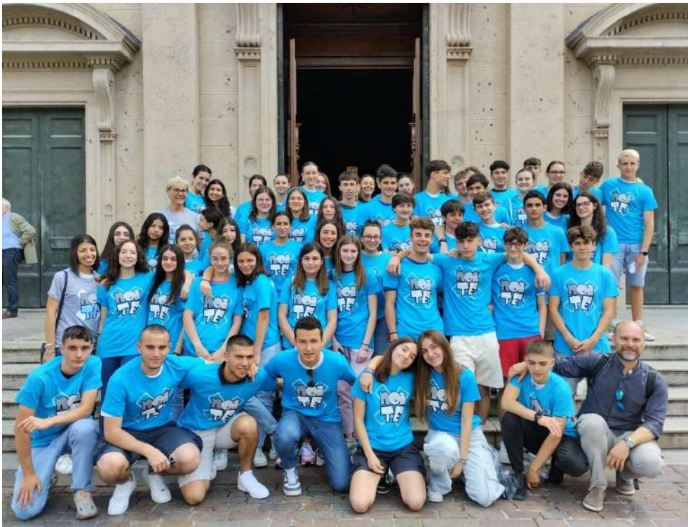
Un gruppo animatori