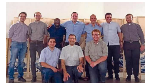
Candidati preti 2021

Padre Santo, nel Tuo Figlio Gesù, Via, Verità e Vita, ci hai resi figli e fratelli amati. Effondi il Tuo Spirito su questi Tuoi servi perché siano testimoni del Tuo comandamento: Camminate nell'amore. Maria, Madre della Chiesa, custodisca il loro ministero. Amen