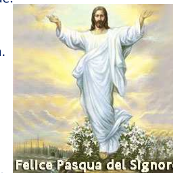
Felice Pasqua del Signore