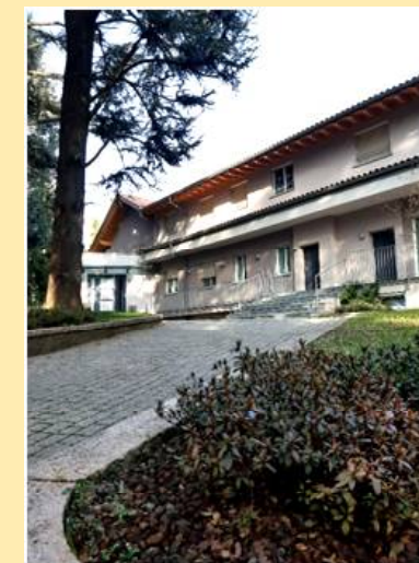
La casa madre