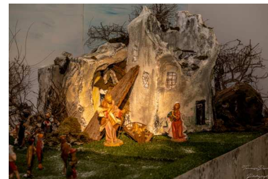
Presepio 2019 in chiesa

O Gesù, accada così anche per noi! Amen.