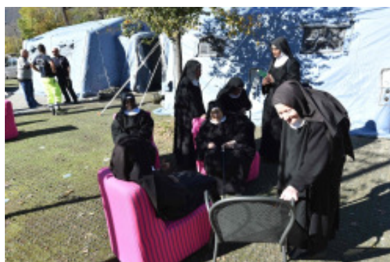
Terremoto a Norcia, anche le Suore Clarisse sono rimaste senza convento.

Tra arte, fede, musica, canzoni, cinema.