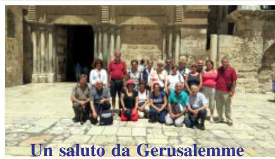
Un saluto da Gerusalemme

* Sabato 20 settembre, a conclusione del Triduo di preparazione alla festa del beato LUIGI MONTI, CONCERTO spirituale ore 21.00 in chiesa.