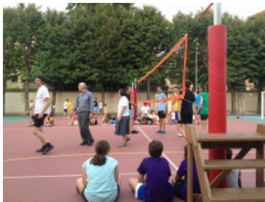
Oggi festa Oratorio via legnani

Festa Oratori Regina Pacis e S. Giovanni Battista