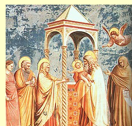
Presentazione di Gesù al tempio e Purificazione di Maria Santissima Candelora

Domenica 07 Giornata della vita ore 16.00 in Chiesa preghiera come da volantino