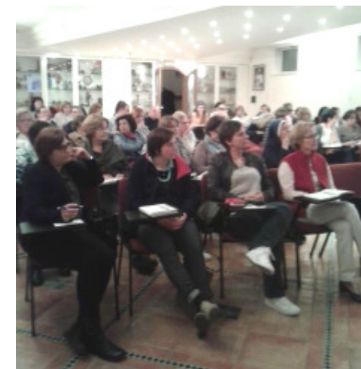
Foto ricordo: la Due Giorni Catechiste a Copreno e la Festa dei Battesimi al P. Monti.

Sono aperte dunque le iscrizioni (anche per i bambini di III elementare). Rivolgetevi alla segreteria parrocchiale o in oratorio per capire come muoversi. Il desiderio è di chiudere questa fase di prescrizione entro maggio.