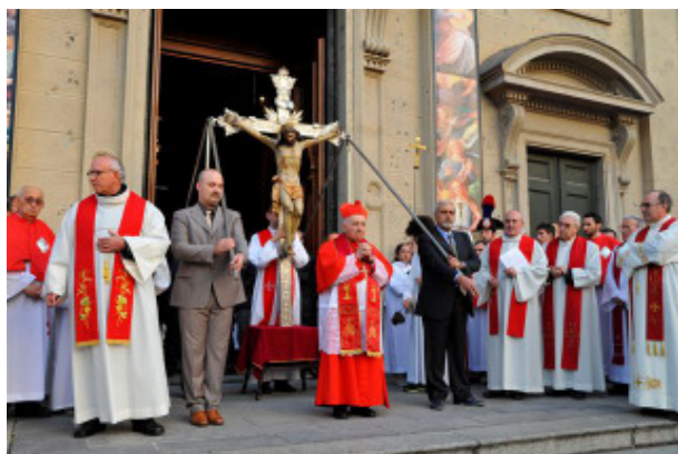
Il card. Dionigi Tettamanzi, alla processione del Trasporto, domenica, 26 ottobre. (foto Bison Edio).

* Metodi per la regolazione naturale della fertilità. Il Consultorio “Profumo di Betania” propone un ciclo di incontri di approfondimento sulla Fertilità e Fecondità di coppia rivolto ai giovani e alle coppie. Martedì 4 Novembre ore 21: “Il linguaggio del corpo” (basi fisiologiche e scientifiche dei Metodi Naturali) Martedì 11 novembre ore 21: “I moderni Metodi Naturali” (quali sono e dove si imparano) presso la sede in Via Marconi n. 5/7. La partecipazione è gratuita. Per informazioni tel. 02 9620798 (orario d’ufficio). * CARITAS: una urgenza. Cercansi due volontari disponibili a dare una mano il sabato pomeriggio per l’accoglienza degli immigrati bisognosi delle docce nel locale a fianco della prepositurale.